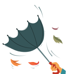
הרוח נושבת קרירה נוסיף עוד קיסם למדורה

ואלו הן רק מספר קטן משלל האפשרויות. בקיצור: תנו חופש לדמיון! גבולותיו הן רק האישור של חבריכם.