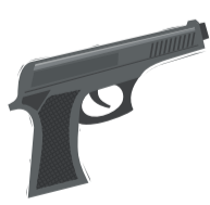
האקדח מת מצחוק