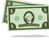
Time is Money

אפשר להשתמש בתכונות מובהקות של העצם. לדוגמה: