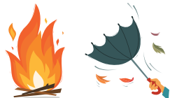
הרוח נושבת קרירה נוסיף עוד קיסם למדורה

ואלו הן רק מספר קטן משלל האפשרויות. בקיצור: תנו חופש לדמיון! גבולותיו הן רק האישור של חבריכם.